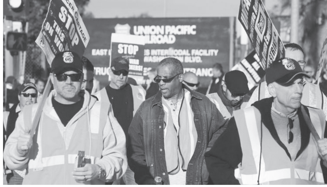
Tre momenti delle lotte degli ultimi anni dei lavoratori del settore logistico nel mondo: