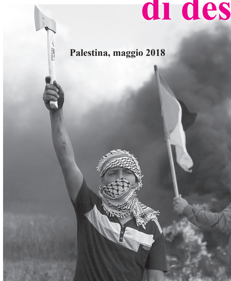
Palestina, maggio 2018