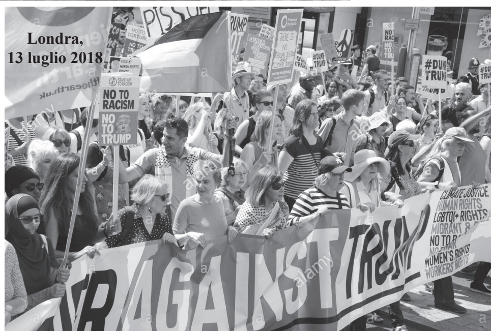
Londra, 13 luglio 2018